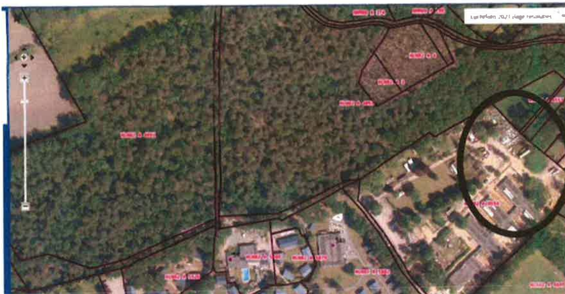
Op de luchtfoto van provincie Limburg van voor juli 2022 is duidelijk te zien dat de groenstrook verwijderd is.