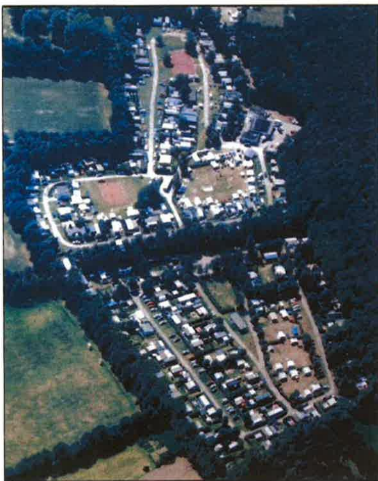
Situatiefoto van de familiecamping "Camping Leudal" omstreeks 2010

In 2010 heeft [REDACTED] de familiecamping "Camping Leudal" gekocht om deze familie camping op te waarderen naar een 5 sterren recreatiepark welke na een transitiefase volgens plan in 2015 operationeel te zijn.